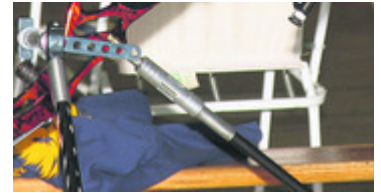
Ein interessantes Sportgerät, das immer mehr Liebhaber findet.